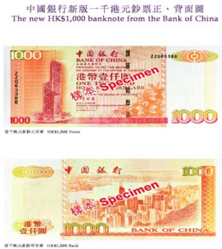
Grafico 1. Modelo de los billetes del banco

En la actualidad el Banco de China tiene filiales en veintisiete países y regiones en todo el mundo. Es el banco chino más importante a nivel internacional y ha sido considerado como el mejor banco a efectos de comercio exterior y de moneda extranjera.