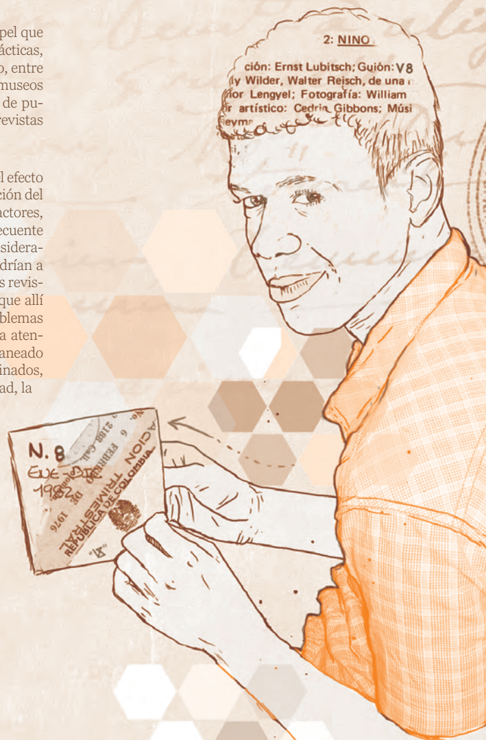
Ilustración: Ernst Lubitsch; Gujón: V8 Diseño: Walter Reisch, de una ilustración de Lengyel; Fotografía: William Reisch; Artístico: Cedric Gibbons; Música de Reymond

Fue la conjunción de estos fenómenos, más que el efecto de alguno en particular, lo que hizo posible la renovación del paisaje cultural caleño, con la irrupción de nuevos actores, apertura a nuevos discursos y tendencias, y consecuente ampliación de los límites de lo tradicionalmente considerado como “cultural” y “artístico”, procesos que no vendrían a madurar propiamente sino hacia la década del 90. Las revistas interesan al contexto cultural tanto por el papel que allí jugaron como por su capacidad para revelar los problemas y complejidades de aquél. Sus limitaciones llaman la atención sobre cómo este no fue un proceso uniforme, planeado y compuesto de actores e impulsos totalmente coordinados, sino más bien uno caracterizado por la heterogeneidad, la simultaneidad, la imprevisibilidad y el conflicto. Esto pudo hacer de las transformaciones mencionadas un fenómeno inacabado, problemático y quizá de modesto despliegue, pero de ninguna manera mediocre o exiguo, tal como lo ilustra lo ocurrido con estas publicaciones.