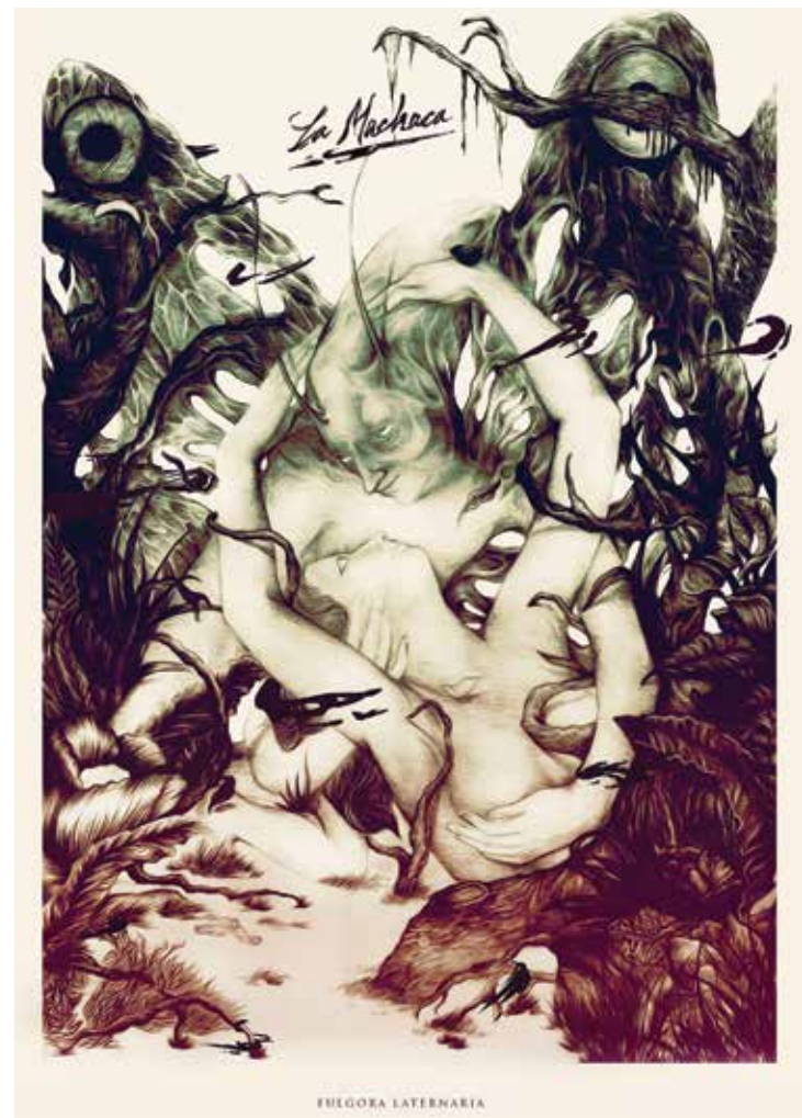
~ JUAN CAMILLO CASTILLO (Colombia)

Ilustración portada: PicaFlor · http://www.flickr.com/photos/pica-flor/