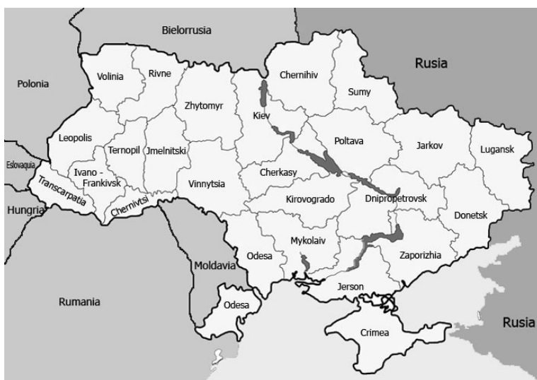
Mapa 1. Ucrania contemporánea

2019- Presidencia de Volodymyr Zelens'kyy.